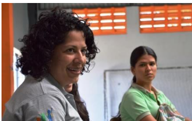
COMPU EN CASA 2018